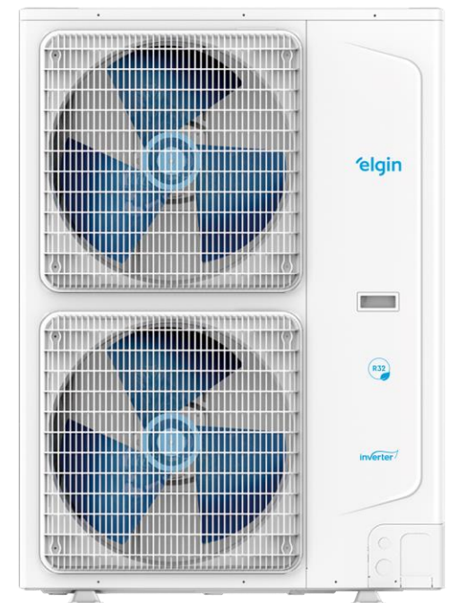
56.000 (Saída de ar Horizontal)