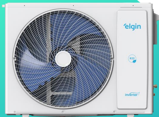
36.000 (Saída de ar Horizontal)