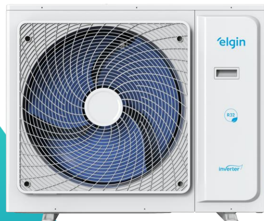
48.000 (Saída de ar Horizontal)